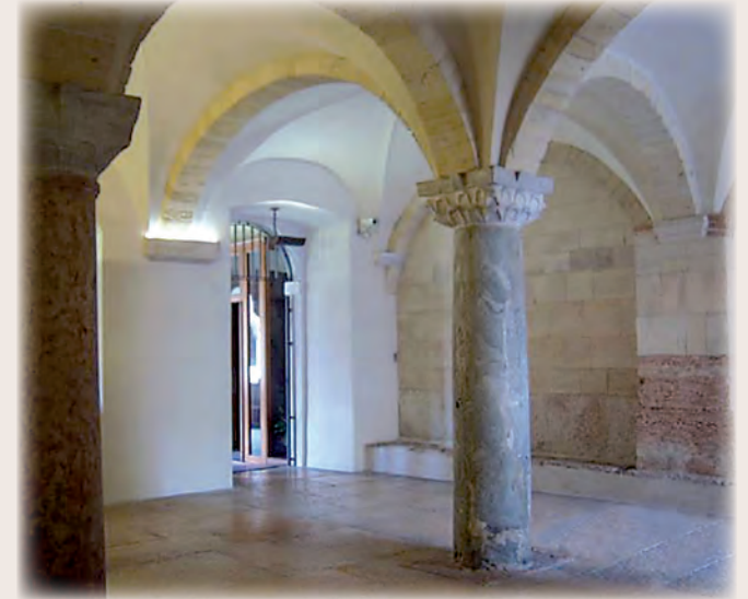
L'antico atrio del monastero restaurato nell'anno 2008

Pazienti lunghi restauri hanno portato alla luce e ricreato ambienti che le vicende Napoleoniche in Verona avevano distrutto e quasi completamente cancellato. Grazie a questo recupero è possibile ripercorrere con la memoria la lunga e gloriosa storia dell'abbazia benedettina di San Zeno.